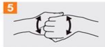
5 Frótese el dorso de los dedos de una mano con la palma de la mano opuesta, agarrándose los dedos;