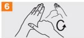
6 Frótese con un movimiento de rotación el pulgar izquierdo, atrapándolo con la palma de la mano derecha y viceversa;