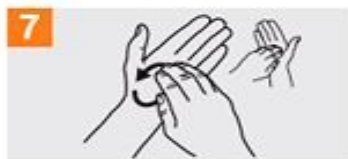
7 Frótese la punta de los dedos de la mano derecha contra la palma de la mano izquierda, haciendo un movimiento de rotación y viceversa;