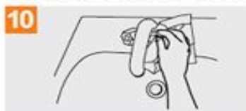
10 Sirvase de la toalla para cerrar el grifo;