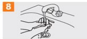
8 Enjuáguese las manos con agua;