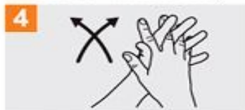
4 Frótese las palmas de las manos entre sí, con los dedos entrelazados;