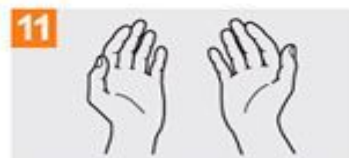
11 Sus manos son seguras.