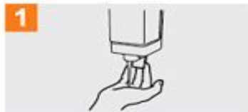
1 Deposite en la palma de la mano una cantidad de jabón suficiente para cubrir todas las superficies de las manos;