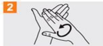
2 Frótese las palmas de las manos entre sí;