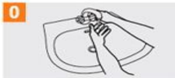
0 Mójese las manos con agua;